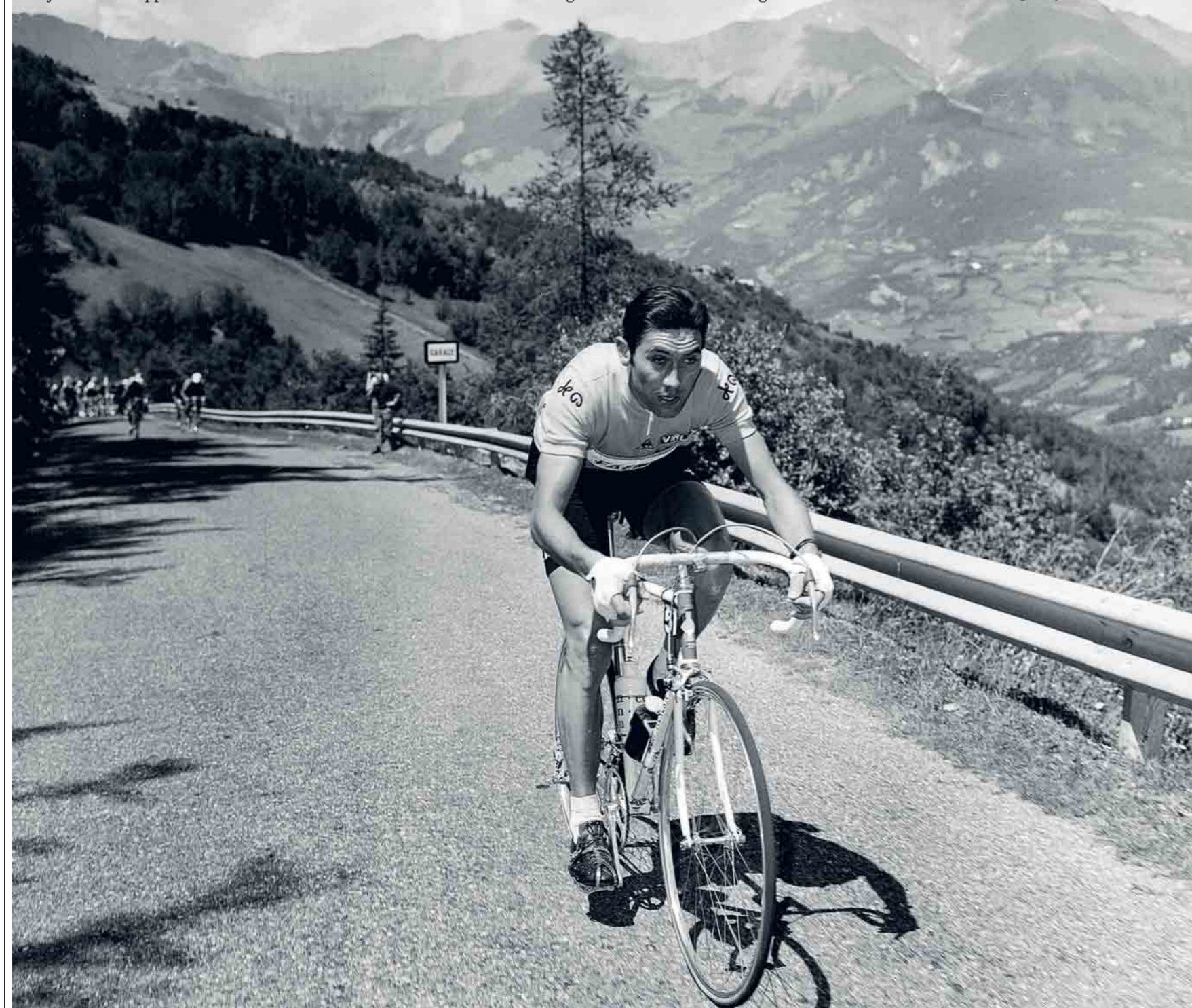
Eddy Merckx op weg naar de zege in de Tour van 1969.

MERCKXISSIMO kost 45 euro en is vanaf 28 april te koop in de boekhandel. De boeken kunnen ook besteld worden via de webshop van www.uitgeverijkannibaal.be